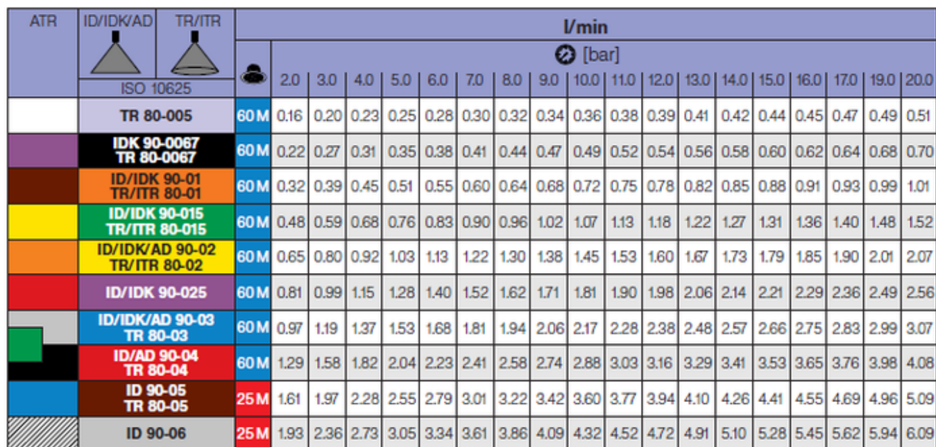
Tabela wydatków jednostkowych rozpylaczy płaskostrumieniowych i wirowych (ISO)

■ wartości dotyczą wody ■ rozpylacze zlitrażować przed każdym sezonem ■ ciśnienie mierzone przy rozpylaczu